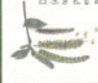
Bétula ( Betula pendula )

Árbore da familia das coníferas de follas aciculares, en pequenos froites, masculinas e femininas en distintas polas. É moi característica a súa follaxe verde-azulada. Árbore moi útil pola súa madeira e resina. O seu froito é a piña.