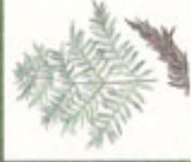
Felito real ( Osmunda regalis )

Pódense observar algunhas panxetónicas sobre o Val de Lourenzá formado polos ríos Batán e Baos, rodeado polas estratificacións montañosas da Serra da Cadieira o Ceidal de Neda e a Serra de Lourenzá.