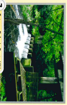
7 Entorno Refugio Ponte Ulló