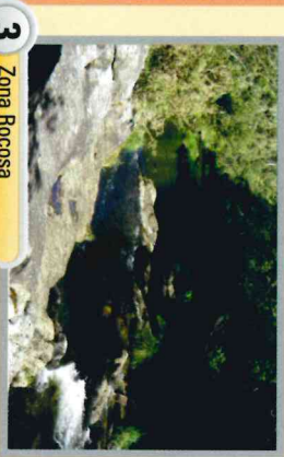
3 Zona Rocosa