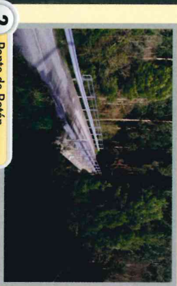
2 Ponte de Batán