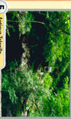
5 Antigua Telesilla