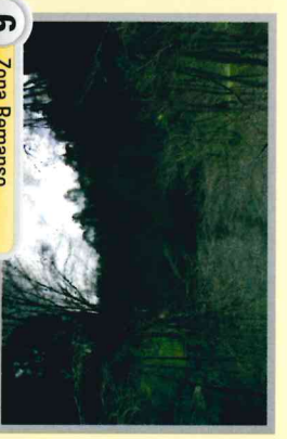
6 Zona Remanso