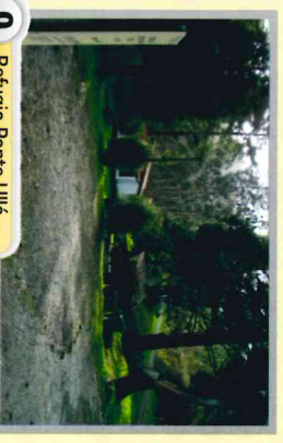
9 Refugio Ponte Ulló