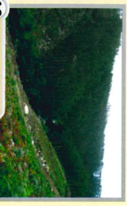
10 Vista Panorámica