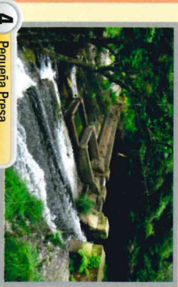
4 Pequeña Presa