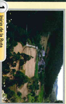
1 Inicio de la Ruta