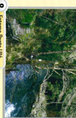
8 Entorno Ponte Ulló