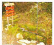
Fonte das Gimenas: Aproveitando un manantial natural creouse esta fonte onde manan augas limpas e cristalinas dende o interior da terra.

Arboriño que non sobrepasa os 6 m de altura, con follas redondeadas e pelosas. O froito son as avelás. Os froitos úsanse como alimento ó ser moi nutritivos, as ramas son longas e flexibles, polo que se empregan para facer cestos.