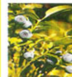
Arando ( Vaccinium myrtillus )

Lugar favorito das Gimenas, pequenos seres misteriosos que frecuentan esta fraga. A estas criaturas do bosque encantalles chapotear y beber nestas augas.