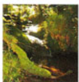
Pozas da Becerreira:

O viaxeiro pode achegarse a un remanso de paz e disfrutar contemplando os pequenos saltos de auga que surcan a zona.