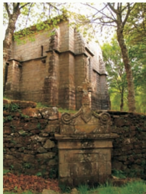
Fonte da Fala e Capela de Santo Alberte