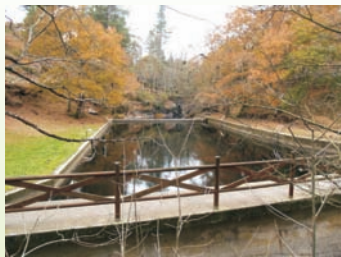
Piscina de Sete Muíños